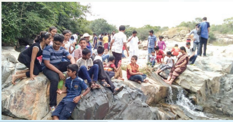
ರಾಷ್ಟ್ರೋತ್ಥಾನ ಯೋಗವಿಜ್ಞಾನ | 14