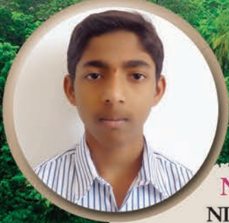
NANDAN A.P. NIT - SURATHKAL